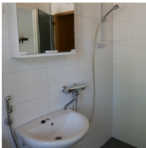
Honkakuja 2 A 4