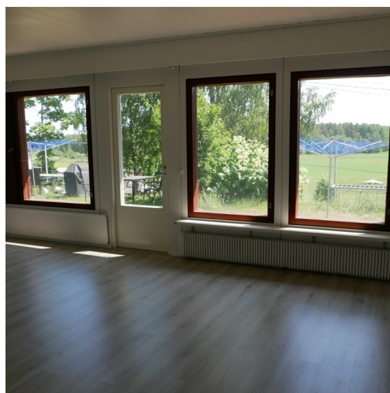
Honkakuja 2 A 4