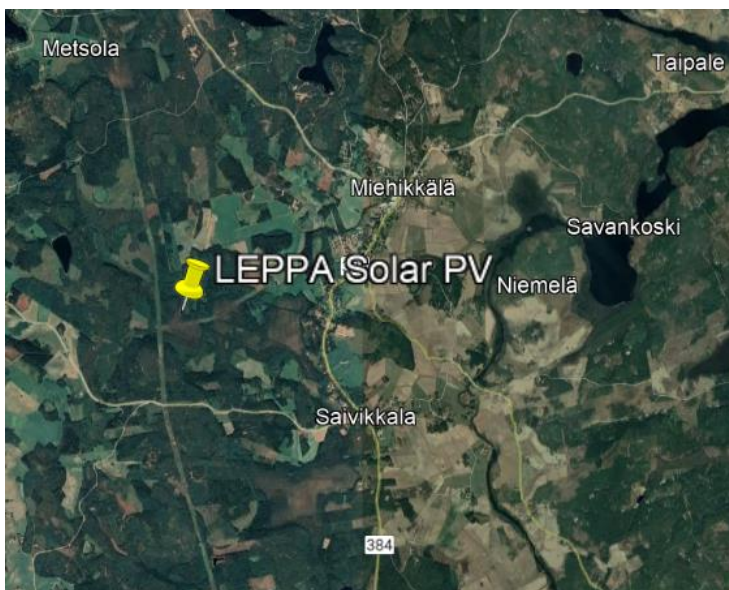
Kuva 2 Hankealueen sijainti.