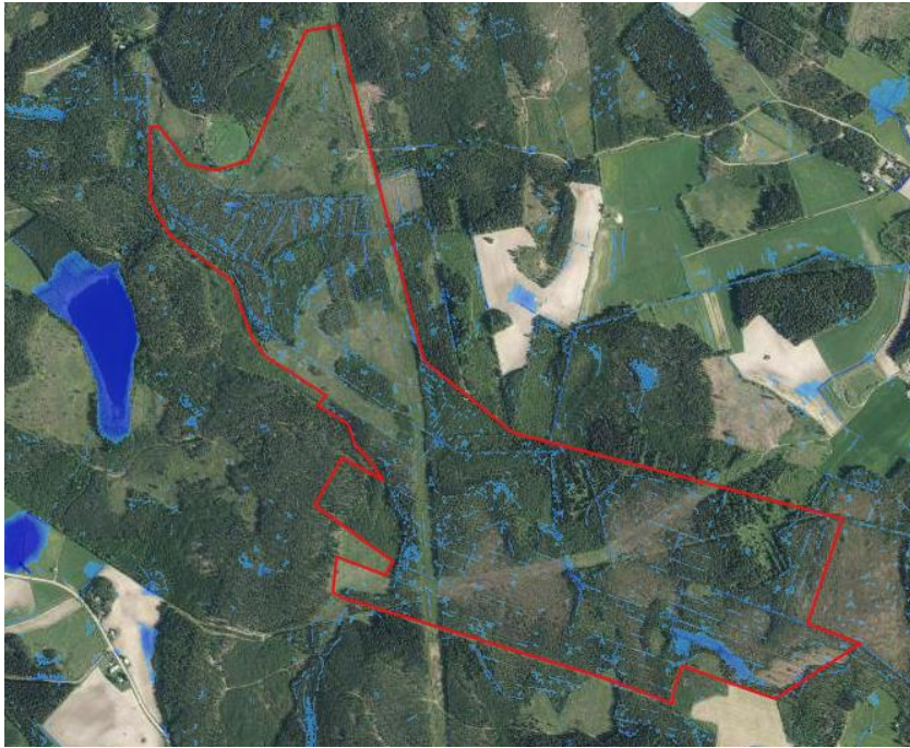
Kuva 4 Arvioidut tulvariskialueet hankealueella Scalgo-työkälulla.