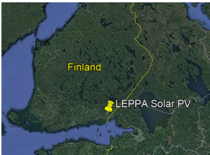
Kuva 1 Hankealueen sijainti.

Selvityksen tarve: Selvitys on osa aurinkovoimahankkeen selityksiä.