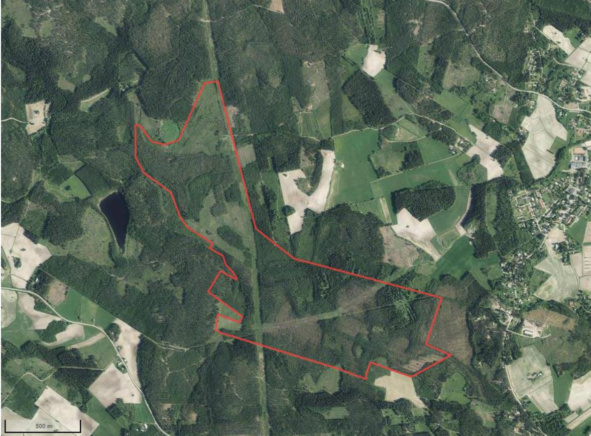
Kuva 6 Hankealueen nykyinen maankäyttö.

Hankealue on ojitettua metsittynyttä suota. Suolla ei ole nostettu turvetta. Noin 0,5 km etäisyydelle hankealueesta on yhteys seututietä 384 ja yhä lähemmäs yksityisteitä pitkin. (Kuva 6)