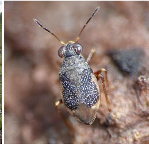
Kuva 4 (vas.). Lepästensuon läpi johtavalla voimalinjalla on monin paikoin paljasta turvepintaa sekä runsaasti tupasvillaa. Kuva 5 (oik.). Maassamme paikoittaisena vain paljalla turvepinnoilla esiintyvä ruoppakirppulude. Lepästensuo 19.7.2023

Suunnittelualueen linnustoon kuuluu tavanomaisia metsälajeja, joista tyypillisin laji on metsäkirvinen ( Anthus trivialis ). Käkiä ( Cuculus canorus ) alueella pesii useita pareja. Myös käpytikka ( Dendrocopos major ), mustarastas ( Turdus merula ), pajulintu ( Phylloscopus trochilus ), peukaloinen ( Troglodytes troglodytes ), vihervarpunen ( Carduelis spinus ) ja punatulkku ( Pyrrhula pyrrhula ) kuuluvat suon pesimälajistoon. Piikinojansuon pienellä lammella pesi vuonna 2023 tavi ( Anas crecca ). Uhanalaisista lajeista alueella pesivät erittäin uhanalainen EN hömötiainen ( Poecile montanus ) sekä vaarantuneeksi VU arvioidut pyy ( Tetrastes bonasia ), jonka ulosteita (kuva 6) löytyi Piikinojansuon reunasta, ja töyhtötiainen ( Lophophanes cristatus ).