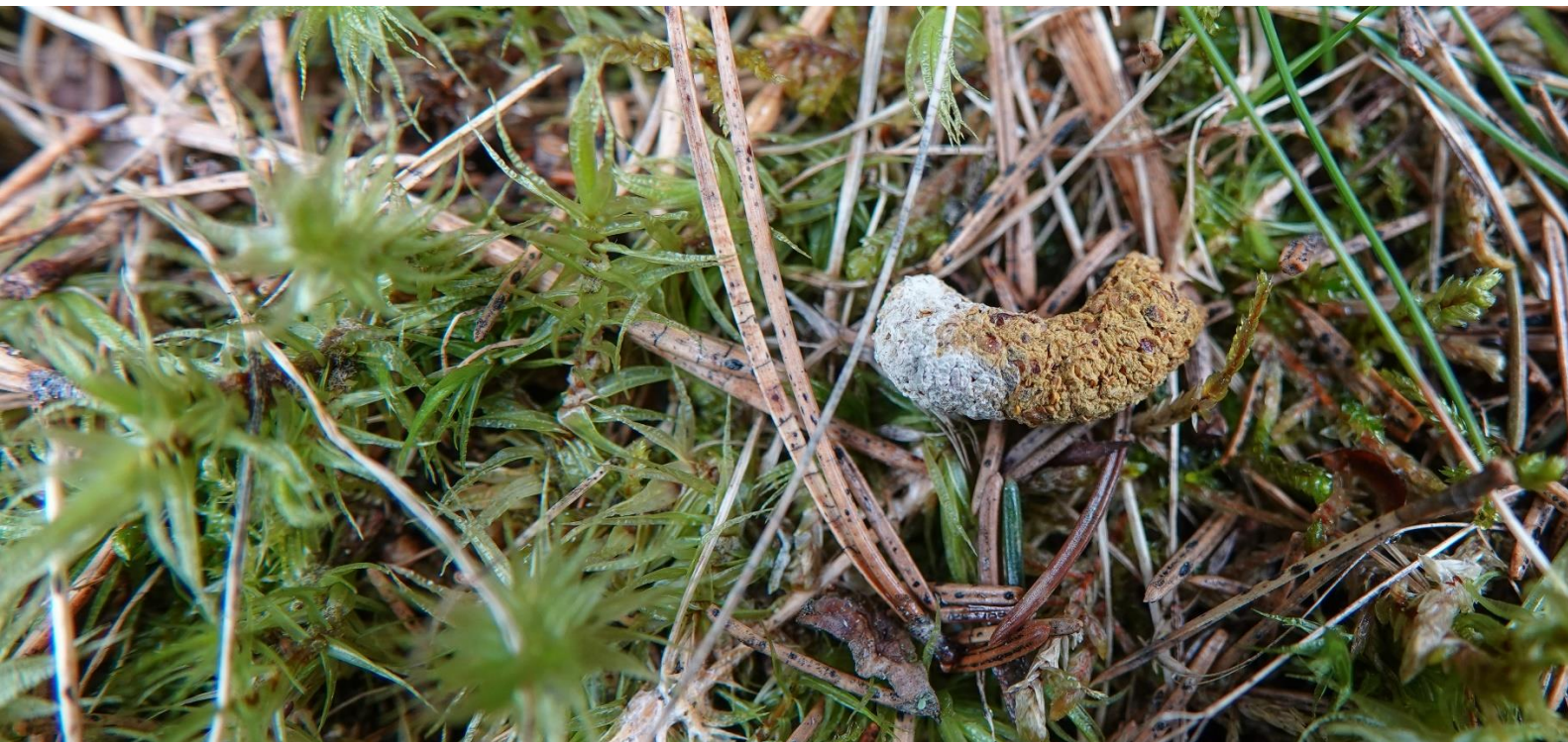
Kuva 6. Uhanalaiseksi arvioidun pyyn uloste Piikinojansuon reunassa 5.5.2023

Suunnittelualueen linnustoon kuuluu tavanomaisia metsälajeja, joista tyypillisin laji on metsäkirvinen ( Anthus trivialis ). Käkiä ( Cuculus canorus ) alueella pesii useita pareja. Myös käpytikka ( Dendrocopos major ), mustarastas ( Turdus merula ), pajulintu ( Phylloscopus trochilus ), peukaloinen ( Troglodytes troglodytes ), vihervarpunen ( Carduelis spinus ) ja punatulkku ( Pyrrhula pyrrhula ) kuuluvat suon pesimälajistoon. Piikinojansuon pienellä lammella pesi vuonna 2023 tavi ( Anas crecca ). Uhanalaisista lajeista alueella pesivät erittäin uhanalainen EN hömötiainen ( Poecile montanus ) sekä vaarantuneeksi VU arvioidut pyy ( Tetrastes bonasia ), jonka ulosteita (kuva 6) löytyi Piikinojansuon reunasta, ja töyhtötiainen ( Lophophanes cristatus ).