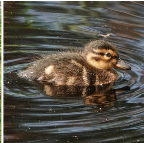
Kuva 8 (vas.). Piikinojansuon pieni lampi ja nevat. Kuva 9 (oik.). Tavin poikanen Piikinojansuon lammella 14.6.2023