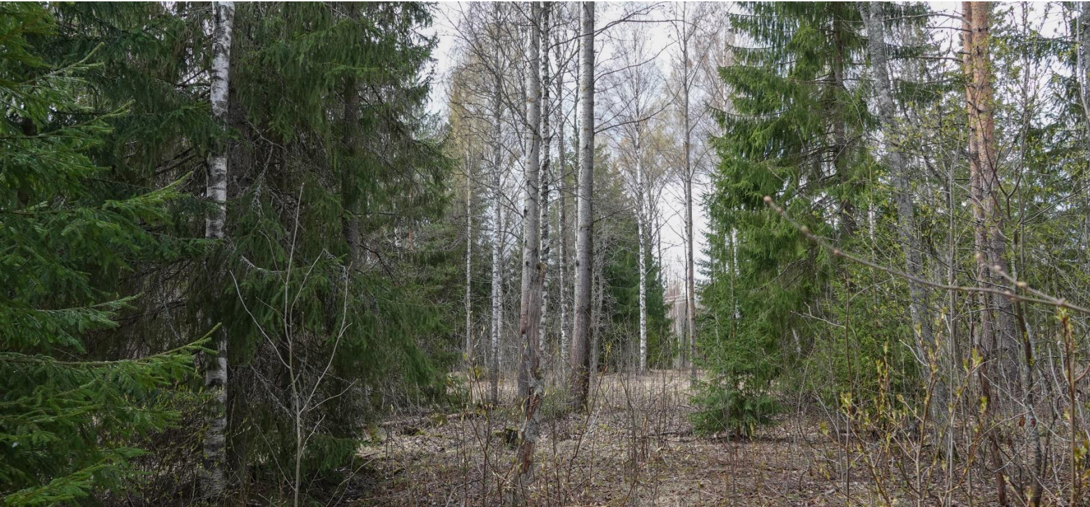
Kuva 7. Liito-oravalle sopivaksi elinympäristöksi arvioitua metsää Lepästensuon pohjoisosassa. Haapojen lisäksi alueella arvioitiin olevan riittävästi suojaustoa. Lepästensuo 5.5.2023