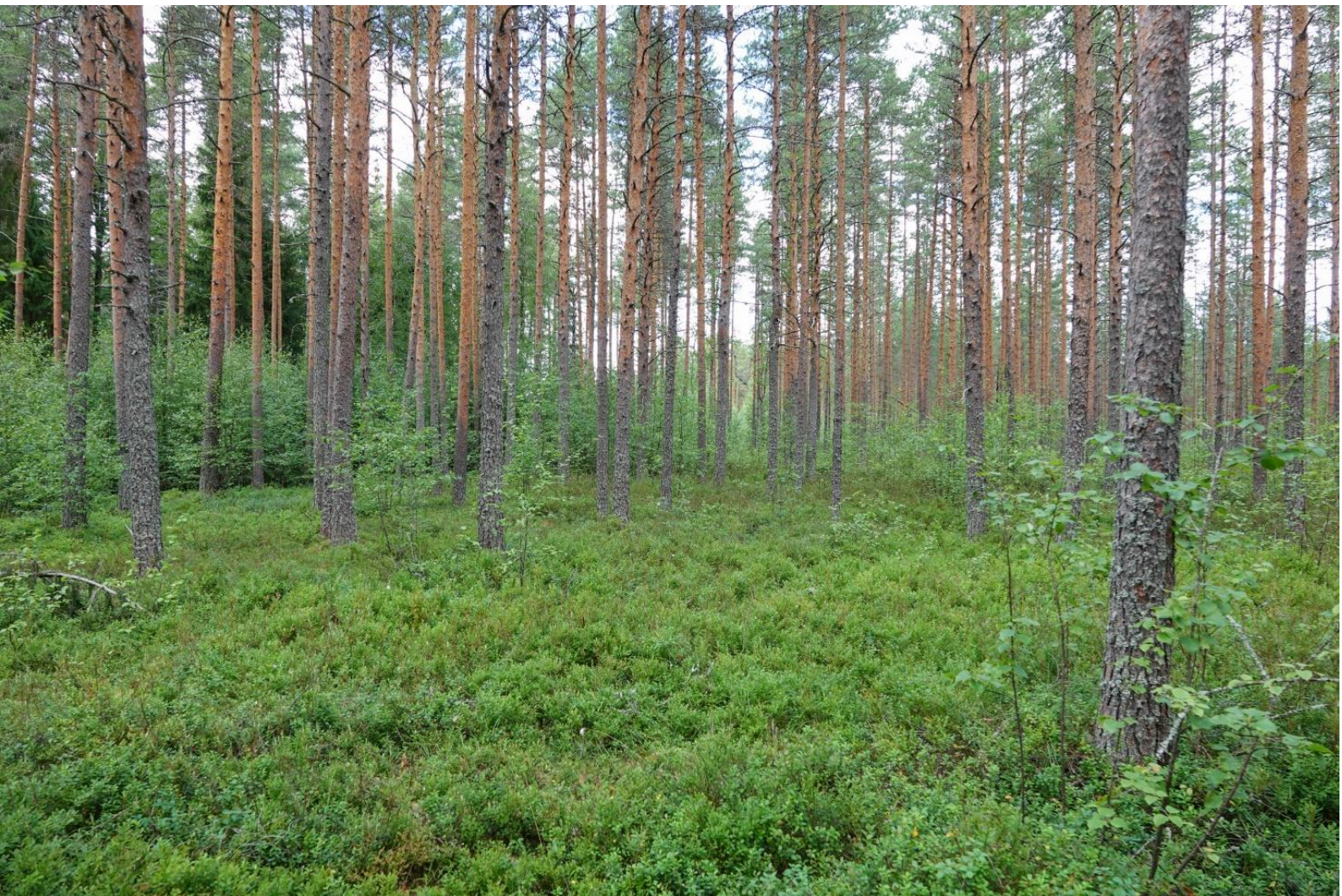
Kuva 1. Lepästensuon turvekangasta, jossa mustikka kasvaa valtavarvuna. Lepästensuo

Eliölaajien uhanalaisuus raportissa perustuu vuoden 2019 arviointiin (Hyvärinen ym. 2019) ja nimistö on Suomen lajitietokeskuksen (Laji.fi) mukaan. Raporttiin poimittiin uhanalaislajistoa ja direktiivilajeja koskevia esiintymistietoja Laji.fi -tietokannasta. Sinne tallennettiin myös tässä luontoselvityksessä kerätty merkittävä lajitieto. Raportti sisältää Maanmittauslaitoksen Avoimien aineistojen tiedostopalvelun ortokuva-, ja peruskartta-aineistoa, 8/2023 (CC 4.0 -lisenssi).