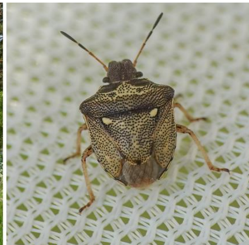
Kuva 2 (vas.). Vanhan asutustilan entistä peltoa, jossa on ketomaisia osia. Kuva 3 (oik.). Vaskilude. Lepästensuo 14.6.2023

Lepästensuon pohjoisosassa on kaksi hylättyä asutustilaa, joiden pellot ja pihapiirit ovat osin metsittyneet. Niiden ympäristössä kasvaa suuria haapoja, joten liito-oravan esiintyminen alueella on mahdollista. Rakennukset ovat pääosin hävinneet, mutta Saarelan tilan päärakennus on edelleen melko hyvässä kunnossa. Yksittäiset pajut, heinäkasvillisuus ja koiranputket vallitsevat entisillä pelloilla, mutta lähellä Saarelan päärakennusta on pienialaisia ketomaisia osia (kuva 2), joissa kasvaa mm. mataroita ja metsäkurjenpolvea. Alueelta löytyi kesäkuun maastokäynnillä melko äskettäin maahamme levinnyt melko harvinainen vaskilude ( Eysarcoris aeneus ) (kuva 3).