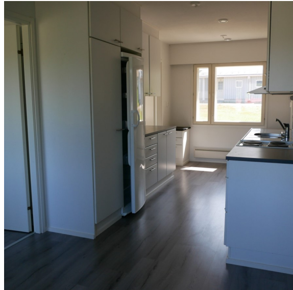
Palotie 10 B 2