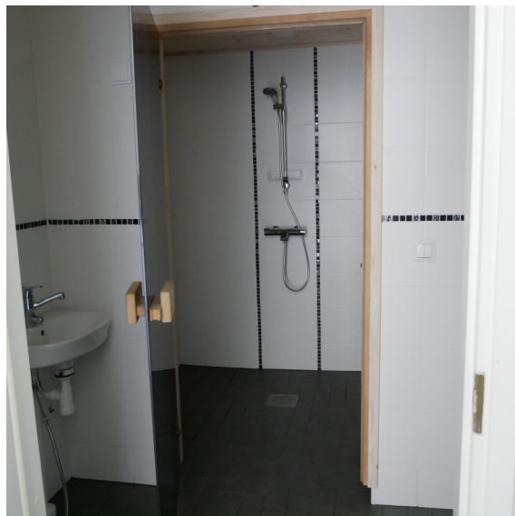
Palotie 10 B 2