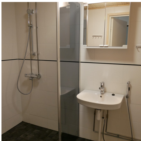
Honkakuja 2 B 2