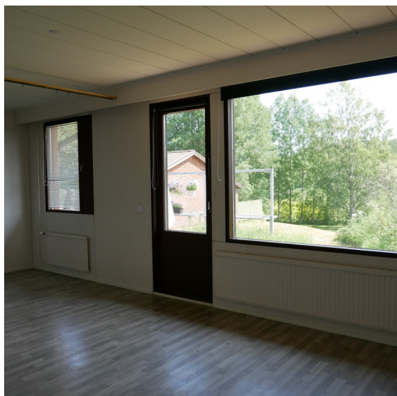
Honkakuja 2 B 2