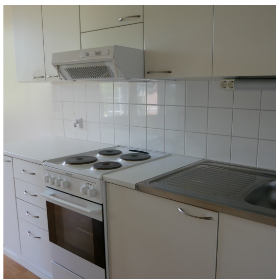
Honkakuja 2 B 5