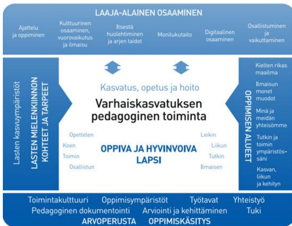
Kuvio 1. Pedagoginen viitekehys (Opetushallitus, 2022)

Varhaiskasvatuksen pedagogista toimintaa ja sen toteuttamista kuvaa kokonaisvaltaisuus. Tavoitteena on edistää lasten oppimista ja hyvinvointia sekä laajaalaista osaamista (kuvio 1).