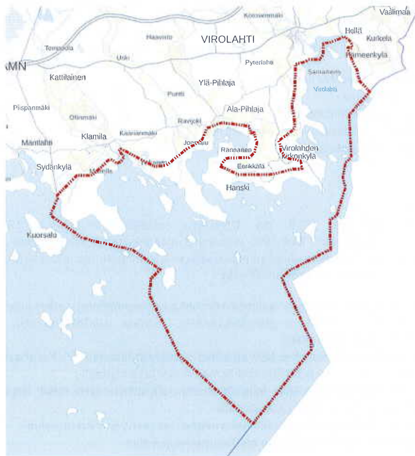
Kuva 1. Suunnittelualueen likimääräinen rajausta punaisella katkoviivalla.

Vuonna 2000 hyväksytty ja vuonna 2017 muutettu Virolahden merenranta-alueiden osayleiskaava on tarkoitus päivittää kokonaisuudessaan. Suunnittelualueeseen sisältyy koko Virolahden merenranta-alue vähäistä Virojoen taajaman edustan ja Klamilan osayleiskaavan aluetta lukuun ottamatta. Suunnittelualueen koko on noin 240 km 2 .