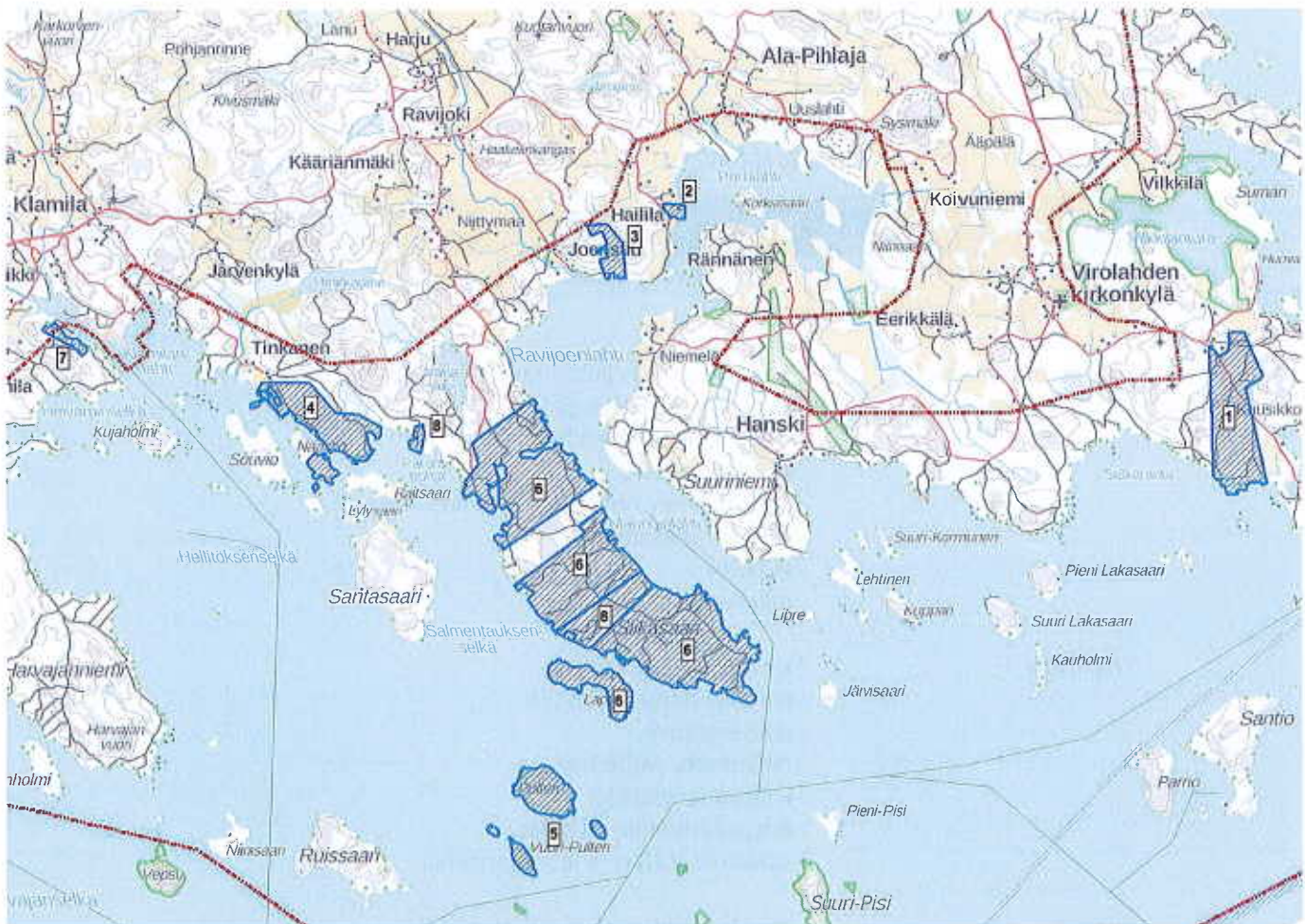
Kuva 4. Suunnittelualueella on voimassa olevien asema- ja ranta-asemakaavojen sijainti: Hurpun asemakaava (1), Haililan ranta-asemakaava (2), Kuusniemen rantakaava (3), Tinkasen rantakaava ja ranta-asemakaavan muutos (4), Pulterin saariryhmän ranta-asemakaava (5), Siikasaaren ranta-asemakaava (6), Jurvasen rantakaava (7), Liikkasen rantakaava ja ranta-asemakaavan muutos (8).

Suunnittelualueella on voimassa Hurpun asemakaava (2020) sekä Haililan ranta-asemakaava (2010), Kuusniemen rantakaava (1992), Tinkasen rantakaava ja ranta-asemakaavan muutos (1990, 2010), Pulterin saariryhmän ranta-asemakaava (2003), Siikasaaren ranta-asemakaava (1991), Jurvasen rantakaava (1990) (6) ja Liikkasen rantakaava ja ranta-asemakaavan muutos (1989, 2000).