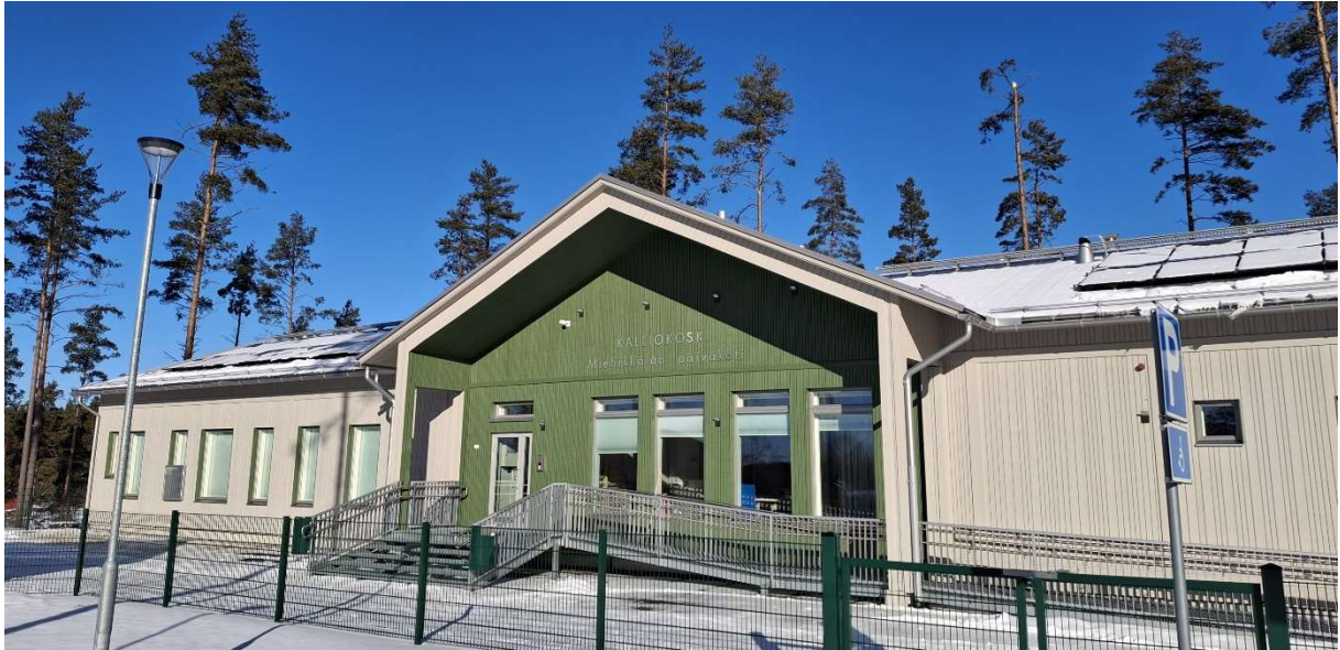
Kalliokosken päiväkoti. Kuva Kati Lavonen