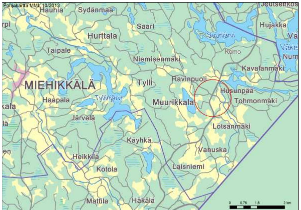
Kuva 1. Suunnittelualueen sijainti suhteessa Miehikkälän kirkonkylään. Suunnittelualueen likimääräinen sijainti merkitty punaisella.

Miehikkälän kunnassa sijaitsevalle Muurikkalan kylän pohjoiselle alueelle laaditaan osayleiskaava. Muurikkalan kylä sijaitsee noin 12 km itään Miehikkälän kirkonkylästä ja noin 50 km etelään Lappeenrannan kaupungista. Suunnittelualueen koko on 444 ha. Muurikkalan eteläisten osien yleiskaava (1.vaihe) on hyväksytty kunnanvaltuustossa 11.6.2012.