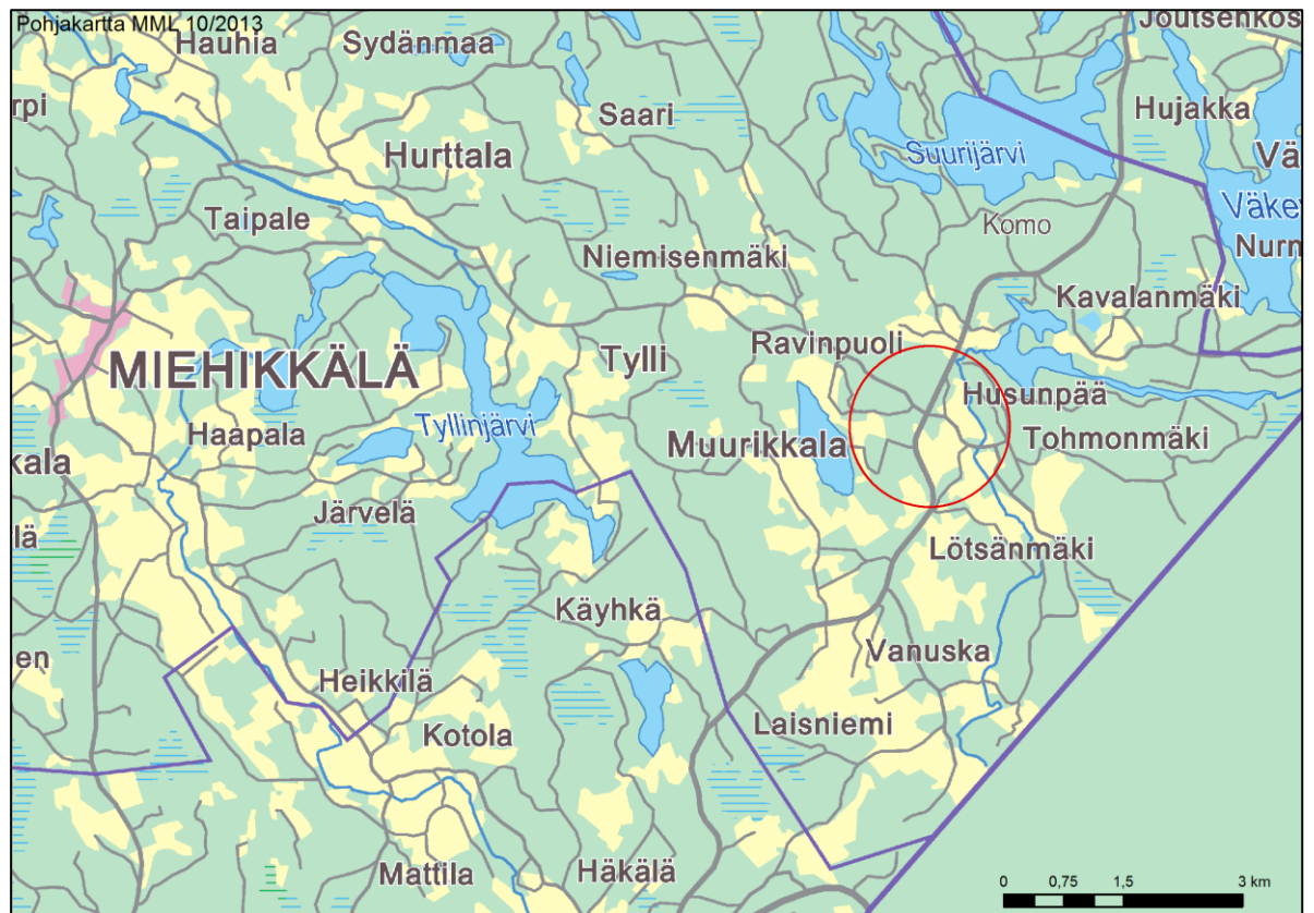
Kuva 1. Suunnittelualueen sijainti suhteessa Miehkälän kirkonkylään. Suunnittelualueen likimääräinen sijainti merkitty punaisella.

Miehikkälän kunnassa sijaitsevalle Muurikkalan kylän pohjoiselle alueelle laaditaan osayleiskaava. Muurikkalan kylä sijaitsee noin 12 km itään Miehkälän kirkonkylästä ja noin 50 km etelään Lappeenrannan kaupungista. Suunnittelualueen koko on 444 ha. Muurikkalan eteläisten osien yleiskaava (1.vaihe) on hyväksytty kunnanvaltuustossa 11.6.2012.