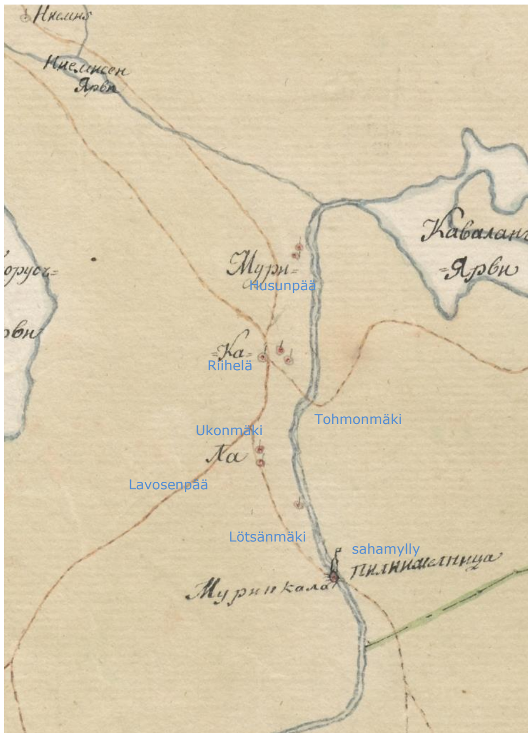
Kuva: Muurikkalan kylän talot 1800-luvun alussa (kartta on yleispiirteinen, asutuksen symbolit osoittavat talokeskittymät/maakirjatalot) / Viipurin kuvernementin revisionikonnttorin kartat [Säkkijärven pitäjän kartta, ven.]. Zweijgberg, F. von, 1804. Mittakaava 1:32 000. KA (sininen teksti lisätty karttaan paikantamisen helpottamiseksi).